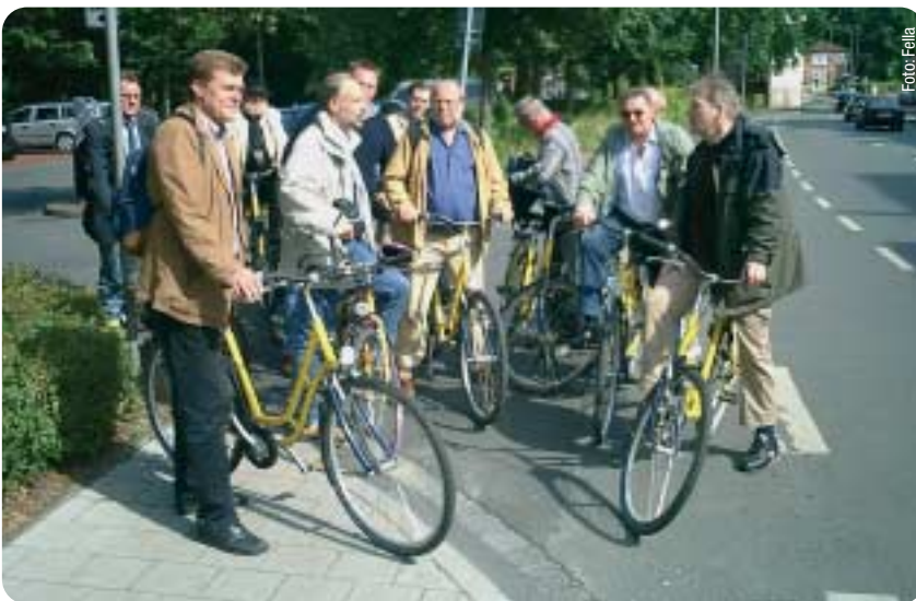
Der Arbeitskreis Verkehr fahrrad-politisch in Münster unterwegs.

Anhand der Erfahrungen aus Münster wird es nicht schwer fallen, überzeugend darzulegen, dass ein höherer Fahrradanteil auch dazu führen kann, die für unsere Bürger notwendigen Autofahrten durch die Stadt stau- und stressfreier zu machen und den Wirtschaftsverkehr zu erleichtern. Wir können damit Verkehrsinfarkte vermeiden und vielleicht auch den einen oder anderen Herzinfarkt.