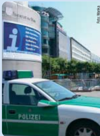
Sicherheit und Sauberkeit sind wichtige Themen für die CDU.

konsequent weitergehen, und etwa auf der Zeil neben der dringend notwendigen Verschönerung für noch mehr Sicherheit und Sauberkeit sorgen. Die Punker-Szene am Brockhausbrunnen soll aufgelöst und eine Verbesserung der Situation an der Hauptwache vor dem Kaufhof erreicht werden. Dazu gehört auch der Einbezug sozial- und gesundheitspolitischer Maßnahmen. Die Fortführung des Frankfurter Weges in der Drogenpolitik unter Stadtrat Burggraf verdeutlicht, dass die Frankfurter CDU den Abhängigen und damit den Kranken Unterstützung anbietet, genauso konsequent aber auch mit aller Härte gegen jene vorgehen will, die etwa als Dealer ihr Unwesen