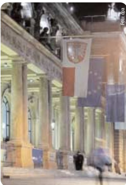
Zwischen Tradition und „globaler“ Moderne: Die Frankfurter Börse bei Nacht.

Eine pauschale Kritik an der Globalisierung hilft nicht weiter. Frankfurt ist zum einen Globalisierungsgewinner, hat sich mit dem Flughafen, der Messe und der Börse gut im Wettbewerb der Städte positioniert. Ebenso wenig ist es hilfreich, pauschal den Markt abzulehnen. Der Markt ist