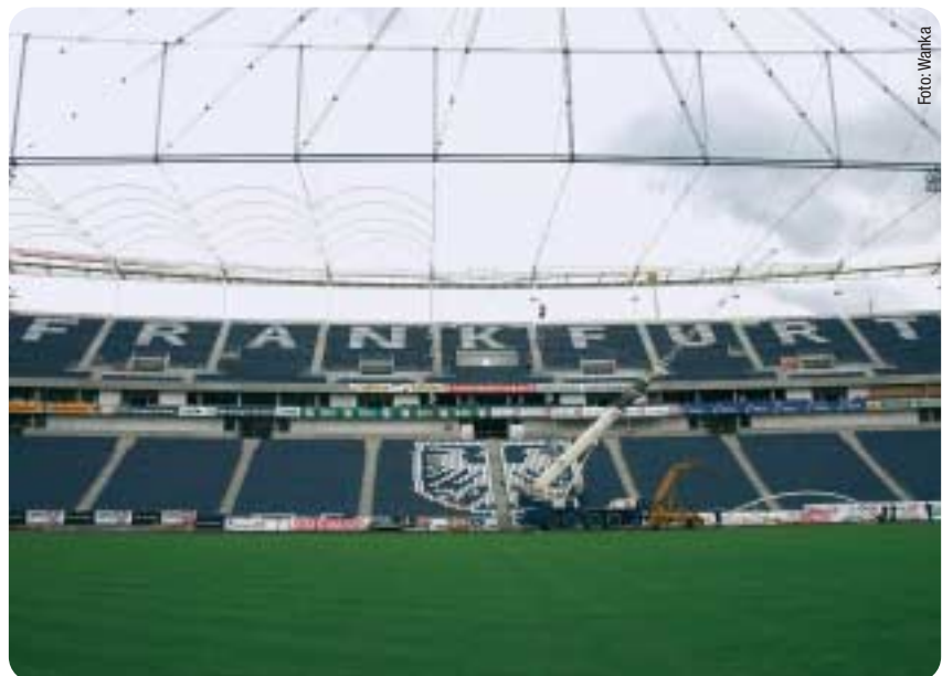
48.500 Sitzplätze, 16.000 mehr als bisher, bietet das neue Stadion – inklusive Stehplätze sogar 53.000.

einem privaten Dritten mit entsprechender Erfahrung und Vernetzung im Markt, Betrieb und Vermarktung des Waldstadions zu übertragen. Der Sportausschuss hat am 08. Juli mit der Mehrheit von CDU und SPD den Betreibervertrag an die Neu-Isenburger HSG Technischer Service GmbH und die Hamburger Sportfive GmbH vergeben. (mw)