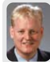
Markus Frank Umweltpolitischer Sprecher der CDU-Fraktion

größte und modernste Flugzeug der Welt künftig nicht in Frankfurt gewartet werden, habe das den Abzug eines beträchtlichen Teils des heute in Frankfurt abgefertigten Luftverkehrs zu Folge. Damit gerate die Drehkreuzfunktion des Flughafens insgesamt in Gefahr und der Job-Motor ins Stottern.