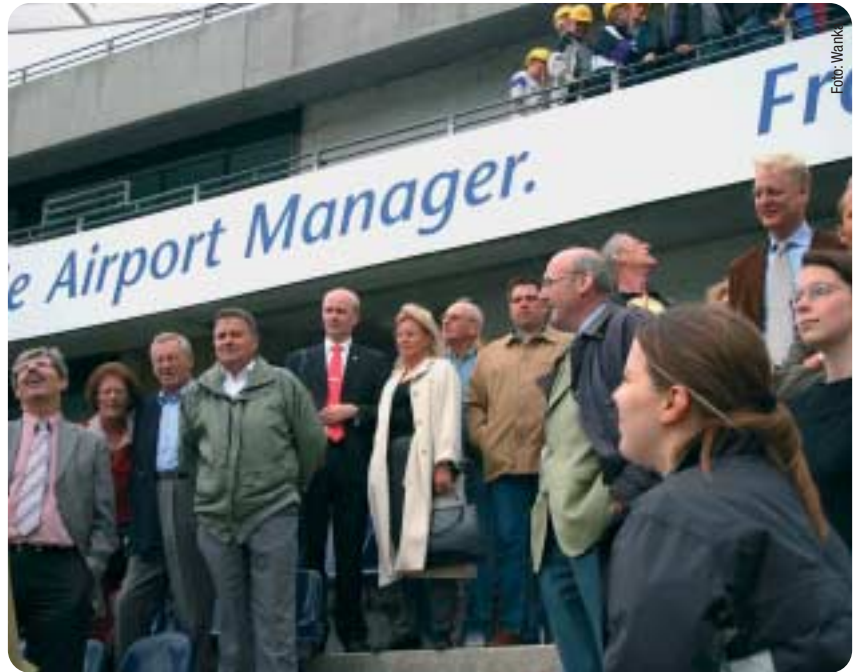
Die CDU-Fraktion bei der Besichtigung des Cabrio-Dachs im Waldstadion.

Im neuen Waldstadion finden fünf Spiele der Fußball-Weltmeis-