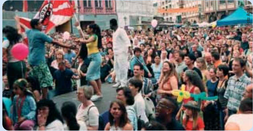
Die Parade der Kulturen – Frankfurt, eine internationale Großstadt.