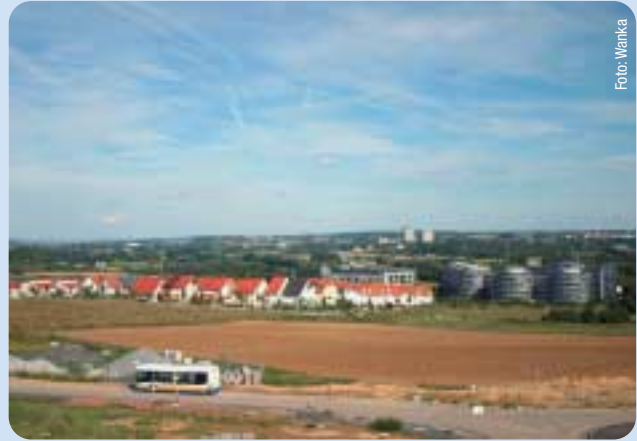
Ein neuer Stadtteil entsteht: Riedberg.

hat neben der baulichen Weiterentwicklung des Mainufers auch die Ansiedlung von Gastronomie und Unterhaltung an den Ufern des Mains zum Programm gemacht. Mit dem Beleuchtungskonzept von Stadtrat Schwarz wird nun der Main auch abends zum attraktiven Erlebnisraum und Anziehungspunkt. Frankfurt soll nicht nur am Main liegen, sondern am Main leben. Mit dem Parkhaus unter dem Main möchte die CDU nicht nur Parkplätze realisieren, sondern die nördliche Mainuferstraße in einen Tunnel legen, damit die Altstadt an den Main rückt und eine herausragende Ufer- und Platzsituation entsteht; der schönste Uferplatz einer deutschen Großstadt, an den sich ein ansprechender Wohnungsbau entlang der Ufer anschließt. Wo Menschen woh-