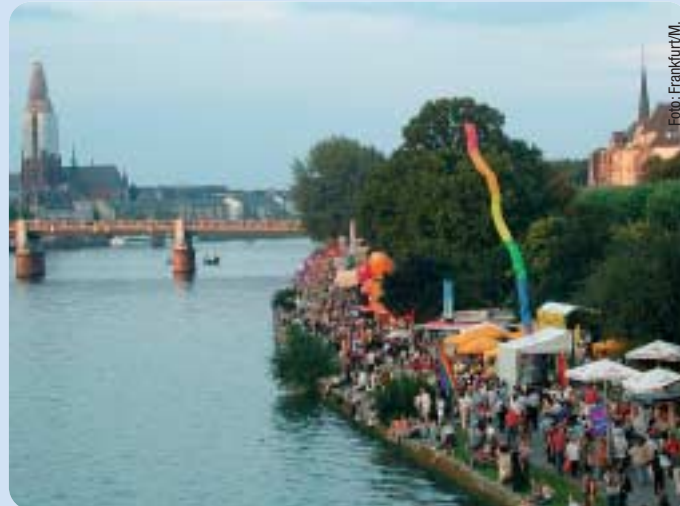
Vielfältige Feste, wie das Museumsuferfest, haben sich in Frankfurt etabliert.

schaft in den deutschen Großstädten heute nur bedingt zugeschrieben. Dies mag daran liegen, dass man der CDU ein zu stark auf das klassische Familienbild zugeschnittenes Profil attestiert und daran einen Mangel an Wahrnehmung der gesellschaftlichen Realitäten festmacht. In Frankfurt hat die CDU längst die Breite heutiger Lebensformen in ihre inhaltliche Arbeit aufgenommen. Dabei spielt die Unterstützung von Familien noch immer eine zentrale Rolle, wenngleich in einer Stadt mit über 50 % Single-Haushalten und den unterschiedlichsten Lebensgemeinschaften auch die Bedürfnisse anderer Bevölkerungsgruppen zu sehen