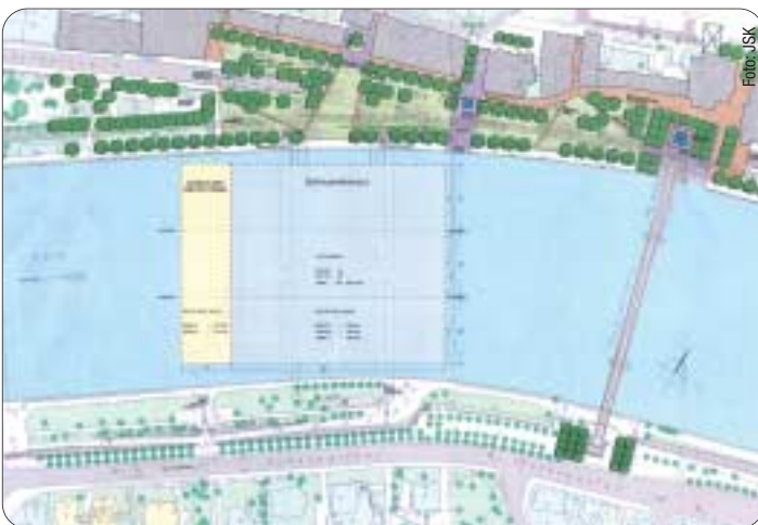
Die Lage der Tiefgarage.

Sollte sich das Interesse von Investoren als nachhaltig herausstellen, würde diese private Finanzierung des Parkhauses auch den