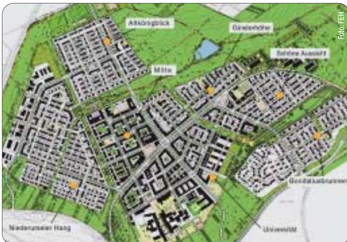
Der Stadtteil Riedberg wächst in sieben Quartieren.

Autobahnnetz angebunden. Bereits seit Juni fährt der Riedberg-Bus, die Buslinie 26, eine Schleife durch das Neubau- und Universitätsgebiet.