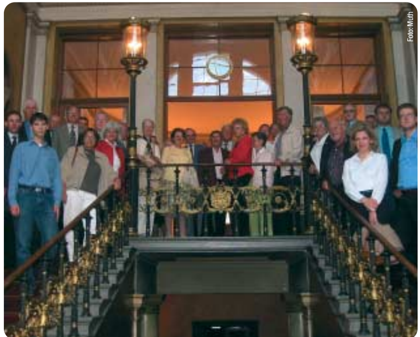
Gruppenbild: CDU-Neumitglieder auf Stippvisite im Hessischen Landtag.

Die Runde war sich einig, dass das Tragen eines Kopftuches kein Akt des Glaubens ist, sondern eine poli-