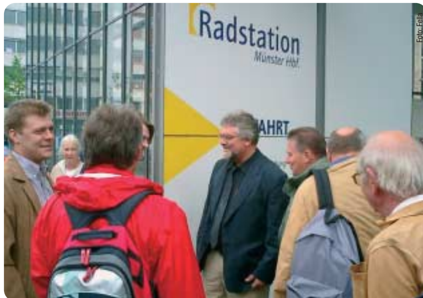
Der Arbeitskreis Verkehr der CDU Fraktion im Gespräch vor dem Fahrradparkhaus.

In Münster werden ca. 35% aller Wege mit den Fahrrad zurückgelegt, in Frankfurt sind es gerade einmal 6%. Den Unterschied sieht man sofort, wenn man am Münsteraner