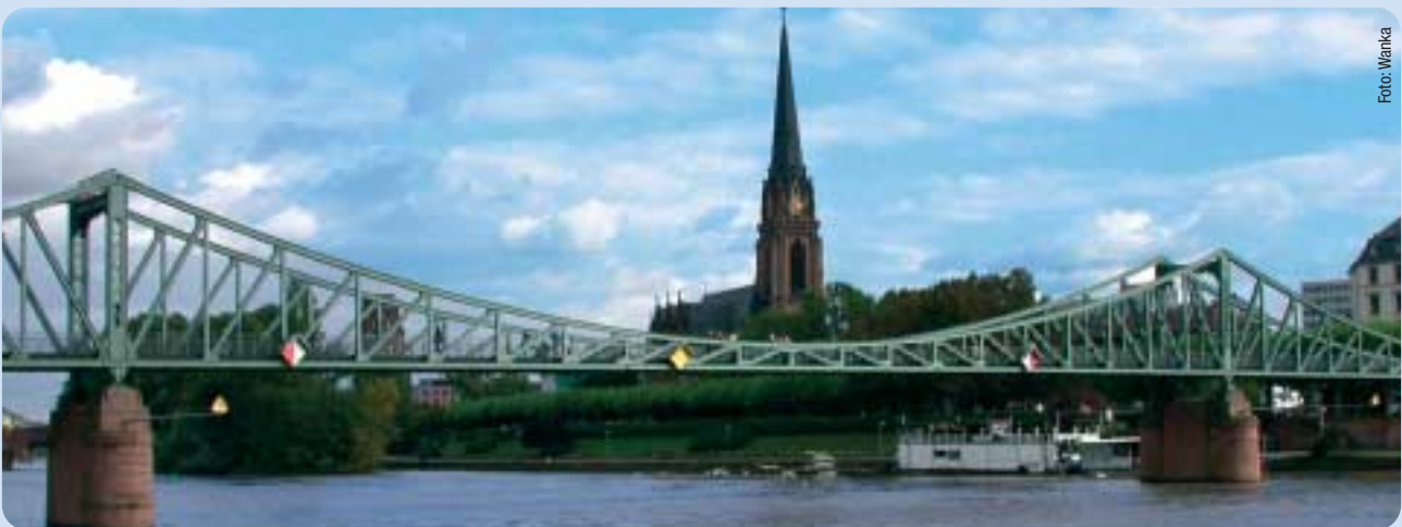
Die CDU setzt sich für die Entwicklung des Mainufers ein. Frankfurt soll nicht nur am Main liegen, sondern am Main leben.

hören, leben Frankfurts Grüne noch immer mit dem erzieherischen Bild einer nahezu autofreien Innenstadt, was nicht nur für Frankfurt als Einkaufsstadt mit katastrophalen Folgen verbunden wäre. Wo die CDU sich den Anforderungen der Lebenssituation der Menschen in unserer Stadt stellt, ist also festzustellen, dass gerade die angeblich so großstädtischen Grünen noch tief in ihrem Nischendenken verhaftet sind. An keiner anderen Stelle wird dies so deutlich wie etwa beim dringend notwendigen Ausbau des Frankfurter Flughafens, gegen den Grüne und SPD zu Felde ziehen. Mehr noch aber als an diesem schon immer konfliktreichen Punkt der politischen Auseinandersetzung wird an anderen Stellen deutlich, dass die Frankfurter CDU mit ihren