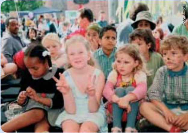
Kinderbetreuung fördern und schaffen ist Anliegen der CDU.