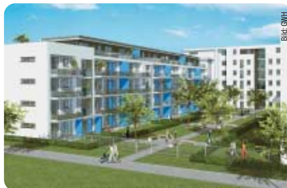
Hof I – Blick in den Wohnhof.

Im Rahmen einer öffentlichen Veranstaltung des CDU-Stadtbezirksverbandes Dornbusch stellte Stadtrat und Planungsdezernent Edwin Schwarz die Pläne für das Bauprojekt „Dornbuschhöfe“ vor. Dieses städtebauliche Wohnkonzept ist das Resultat einer Zusammenarbeit der Gemeinnützigen Wohnungsgesellschaft Hessen mbH (GWH) mit dem Architekturbüro Prof. Bremmer, Lorenz, Frielinghaus, dem Stadtplanungsamt und dem Polizeipräsidium Frankfurt am Main. Die „Dornbuschhöfe“ werden citynah eingebettet zwischen dem architektonisch-modernen Polizeipräsidium und dem Hessischen Rundfunk. Auf dem 25.800 qm großen ehemaligen PX-Gelände der US-Army entstehen drei Wohnhöfe mit Begrünung und