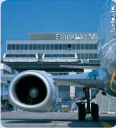
Frankfurts Rollenvielfalt als Finanzzentrum oder Messestadt steht in direkter Abhängigkeit von der Leistungsfähigkeit des Flughafens.