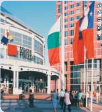
Frankfurt – auch eine internationale Messestadt.