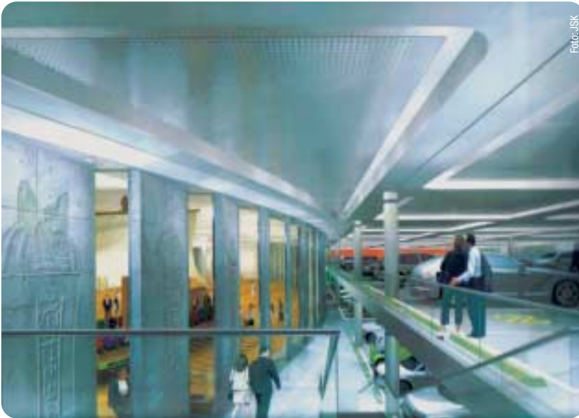
Das Innere des Parkhauses mit der Ausstellungsfläche für das Museum der Weltkulturen.

so den derzeitigen Druck aus den Wohngebieten im südlichen Mainufer nehmen.