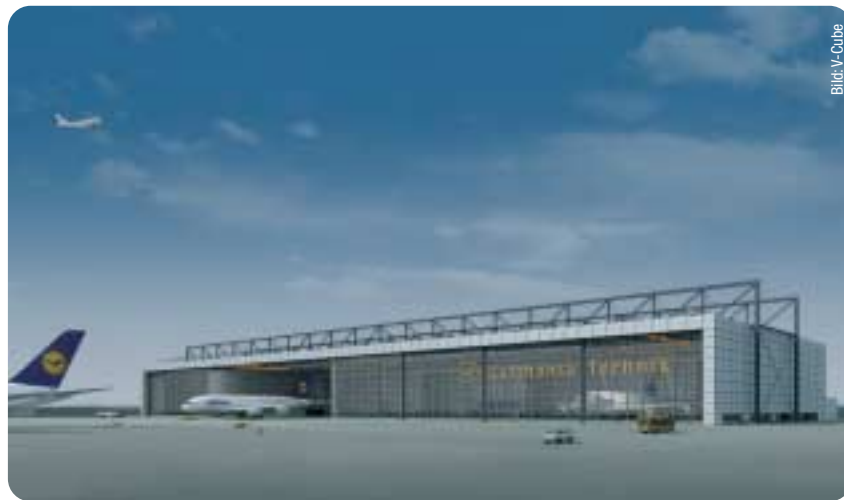
Computeranimation des geplanten Wartungshangar für Airbus A 380 am Frankfurter Flughafen.

„Der Erlass des Planfeststellungsbeschlusses ist ein wichtiger und weitsichtiger Schritt der Hessischen Landesregierung zur Zukunftssicherung des Frankfurter Flughafens. „Nach der Grundsatzentscheidung der Regionalversammlung vom 5. November, grünes Licht für den Bau der Wartungshalle für den neuen Airbus A 380 zu geben, und der Entscheidung des Darmstädter Regierungspräsidenten, den Sofortvollzug zum Bau der Airbushalle zuzulassen, ist dies ein weiterer guter Tag für Frankfurt, die Region und für das ge-