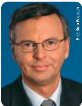
Wolfgang Bosbach MdB.

Der stellvertretende Vorsitzende der CDU/CSU-Bundestagsfraktion, Wolfgang Bosbach MdB, hat bei einer Veranstaltung des Arbeitskreises Außen- und Sicherheitspolitik der CDU Frankfurt im Frankfurter Presseclub vor rund 100 Zuhörern erneut für die privilegierte Partnerschaft anstelle einer Vollmitgliedschaft der Türkei in der EU geworben. „Die von der Bundesregierung angestrebte Aufnahme der Türkei ist ein schwerer Fehler“, sagte Bosbach. Allein die privile-