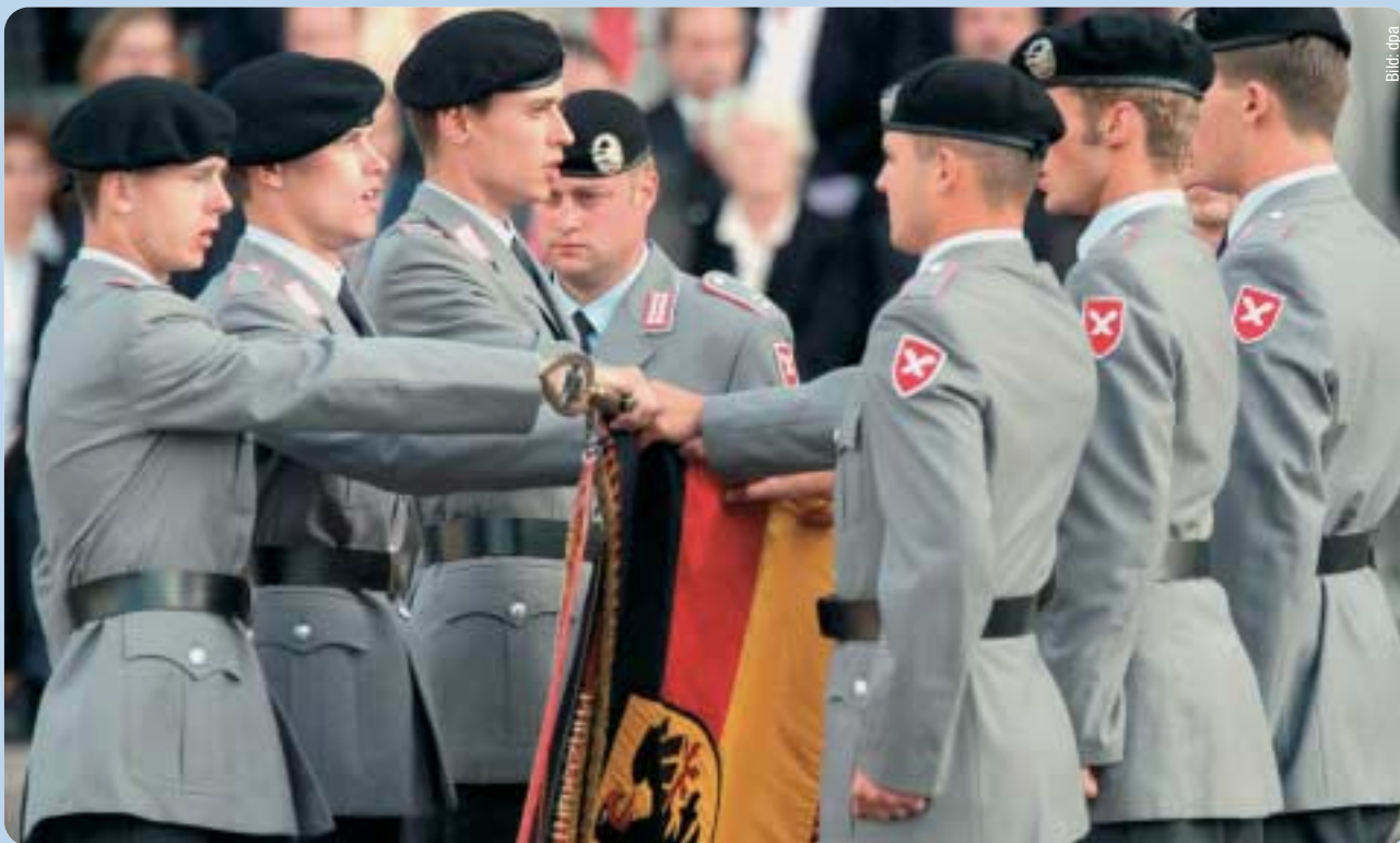
Wehrpflicht: Ausdruck der gemeinsamen Verantwortung aller Bürger für Demokratie und Gemeinwesen.

Die Wehrpflicht ist dabei eng mit dem Heimatschutz verbunden. Mit dem Reformkonzept „Bundeswehr 2010“ des Verteidigungsministers wird der Heimatschutz auf eine reine Statistenrolle zusammengestrichen, insbesondere in den Bereichen Abwehr atomarer, bakteriologischer und chemischer Kampfstoffe (ABC-Truppe), Pionierwesen und Reservelazarettorganisation verringert sich die Einsatzbereitschaft erheblich.