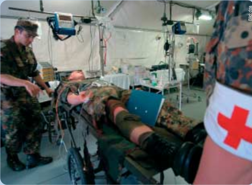
Unterversorgung im Katastrophenfall: Auflösung der Reservelazarette der Bundeswehr.

Die Weichen sind damit falsch gestellt. So ist die Auflösung der für die territoriale Verteidigung zuständigen Verteidigungsbezirkskommandos – für Hessen das Verteidigungsbezirkskommando 47 in Gießen – ein regionaler sicherheitspolitischer Kahlschlag. Ein über Jahrzehnte im Bereich der Reserve gewonnenes Know-how wird dadurch verloren gehen. Die sicherheitspolitischen Auswirkungen des Abzugs der Truppe auf die