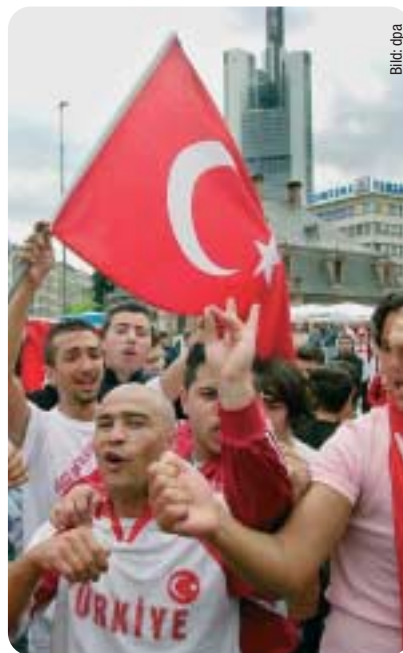
Jubelnde Türken in Frankfurt am Main.

tion als Brücke zum islamischen Kulturraum besser erfüllen, wenn sie nicht Vollmitglied der Europäischen Union ist.“ (jr)