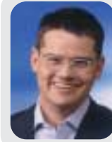
Boris Rhein Landtagsabgeordneter und stellvertretender Kreisvorsitzender der Frankfurter CDU

es nur eine Frage der Zeit, bis immer mehr Freiwillige Feuerwehren nicht mehr einsatzfähig wären. Rhein begrüßte die Initiative des Hessischen Innenministers, Volker Bouffier, eine Sonderförderung in Höhe von 1 Million Euro zukommen zu lassen. Rhein sagte, dies unterstreiche, dass die Landesregierung die herausragende Rolle der Jugendfeuerwehren für die Zukunft der hessischen Feuerwehren besonders würdigen würde. In