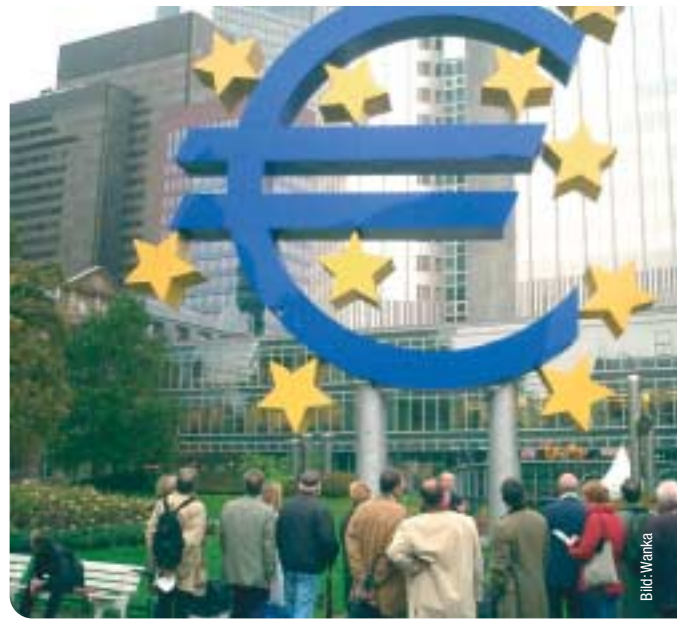
Auch das viel diskutierte Eurozeichen am Willy-Brandt-Platz war Inhalt des Rundgangs.

Fertigstellung der Tiefgarage sprach sich die CDU-Fraktion erneut für den Bau eines Gebäudes in Höhe der Junghofstraße aus. Einem Pavillon entlang der Börsenstraße, wie er von Architekten und Geschäftsleuten vorgeschlagen wurde, steht die Fraktion weiterhin ablehnend gegenüber – insbesondere da ein solcher den Großteil des Goetheplatzes verdecken würde.