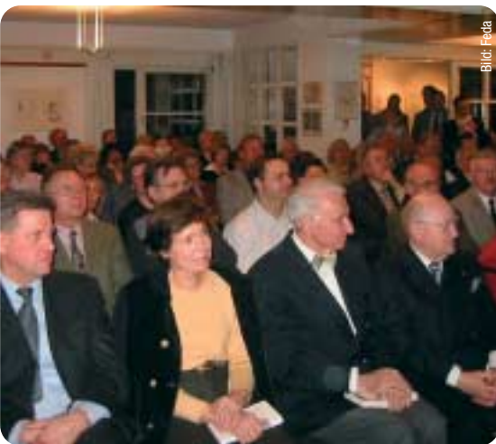
Mit ca. 120 Teilnehmern war der Frankfurter Presseclub überfüllt.

In der ersten Veranstaltung der Reihe „Nachdenken – Vordenken“ wurde das Modell Deutschland schonungslos analysiert. Gabor Steingart, Leiter des SPIEGEL-Hauptstadtbüros in Berlin, sprach vor 120 Zuschauern im Frankfurter Presseclub zum Thema „Deutschland – Der Abstieg eines Superstars“. Sein gleichnamiges Buch ist inzwischen zum Bestseller gekürt worden.