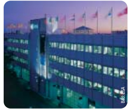
Die ESA in Darmstadt.

im Maßstab 1:1 von zurzeit im fernen Weltraum fliegenden Satelliten bestaunen und bekam kompetent zahlreiche Fragen zur Kontrolle von Satellitenmissionen und zur Erforschung von Sonne, Mars und Kometen beantwortet, letztlich aber auch, warum für so eine bedeutende Einrichtung der European Space Agency (ESA) ausgerechnet die hessische Stadt Darmstadt den Zuschlag erhielt. Die Antwort war einleuchtend: Man brauchte für die Einrichtung eines Europäischen Weltraumkontrollzentrums 1967 einen Großrechner mit einer für damaliges Technologieniveau selten zu findenden Spitzen-