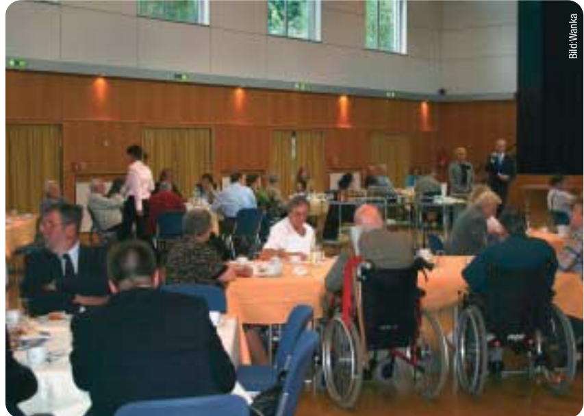
Mehr als 70 Gäste fanden sich wieder einmal im Haus Ronneburg ein.