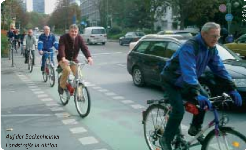
Auf der Bockenheimer Landstraße in Aktion.