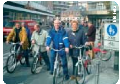
Fahrradstraße an der Katharinenpforte.

Aber der Praxistest der CDU-Stadtverordneten hat auch Handlungsbedarf jenseits der Infrastruktur erkennen lassen, der von aktuellen Forschungsergebnissen gestützt wird. Die im Fahrrad liegenden Mobilitätspotenziale werden sich nur dann ausschöpfen lassen, wenn Radverkehr als System erkannt wird, in dem mehrere Komponenten zusammenspielen. Service, Information und Kommunikation sind Bausteine, mit denen mit vergleichsweise geringen Mitteln hoher Nutzen zu erzielen ist. In Wegweisung, Bike-and-Ride, Festsetzung von Fahrradabstellplätzen in Bebauungsplänen, Radfahren gegen die Einbahnstraße auch in innenstadtfernen Stadtteilen und Öffentlichkeitsarbeit liegen für die CDU-Fraktion weitere Verbesserungen zur