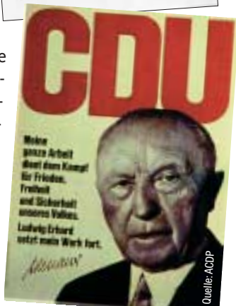
Wahlwerbung: 1965 zur Bundestagswahl und 1972 zur Kommunalwahl in Frankfurt a. M.