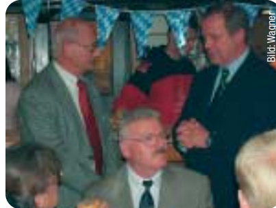
Staatsminister Udo Corts MdL im Gespräch mit dem Griesheimer CDU-Stadtverordneten Peter Wagner.

Der CDU-Kreisvorsitzende und Hessische Minister für Wissenschaft und Kunst, Udo Corts MdL, hat auf dem Griesheimer Abend des Ehrenamtes 2004 die Bedeutung des Ehrenamtes unterstrichen. Der Griesheimer Abend des Ehrenamtes, zu dem der Stadtverordnete und Griesheimer CDU-Vorsitzende Peter Wagner alljährlich einlädt, will den im Stadtteil Griesheim ehrenamtlich tätigen Menschen den Dank der Gesellschaft übermitteln. Corts lobte insbesondere die unverzichtbare Arbeit der Freiwilligen Feuerwehren, des Roten Kreuzes und der übrigen Organisationen des Rettungsdienstes. Der Vorsitzende des gastgebenden Vereins, Kleingartenverein Kastanien-