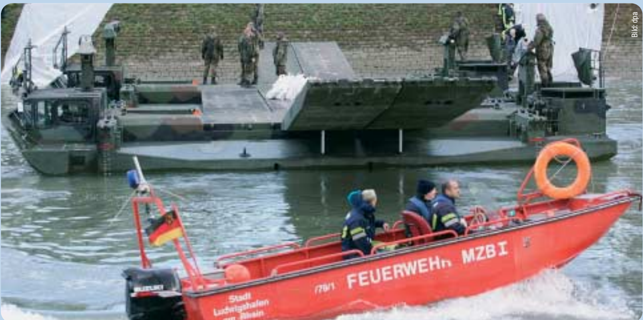
Hochwasserschutzübung der Bundeswehr.

Richtig ist, dass die Bundeswehr auf die neue Bedrohungslage ausgerichtet werden muss. Dazu gehören aber nicht nur Auslandseinsätze bzw. eine reine Einsatz- und Interventionsarmee. Der Heimatschutz darf nicht vernachlässigt werden. Struck hat mit seinem Reformkonzept die Weichen für Deutschlands Sicherheit endgültig falsch gestellt. Dadurch wird eine gefährliche strategische Sicherheitslücke geöffnet.