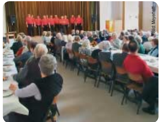
Ganz in Rot: Die „Happy Singers“ erfreuten die zahlreichen Gäste und Freunde der CDU Eckenheim.

Bestandteil dieser guten Gewohnheit waren in diesem Jahr