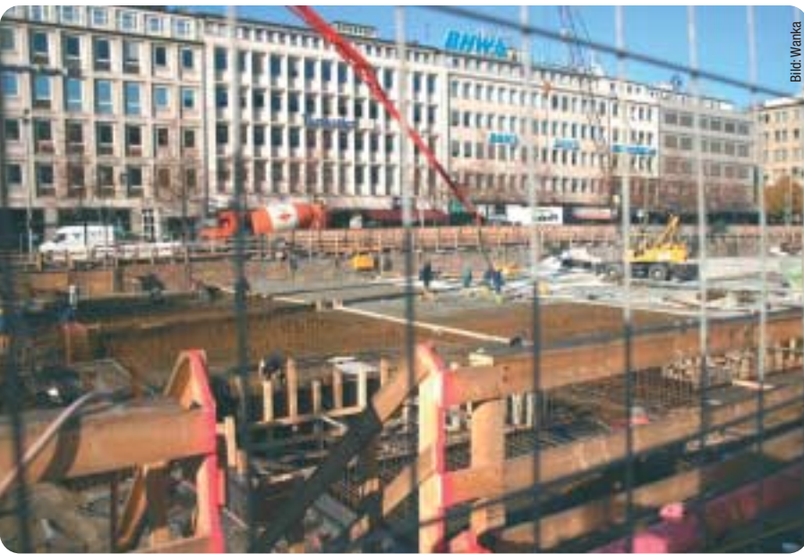
Die aktuelle Situation am Goetheplatz – Bau einer Tiefgarage.