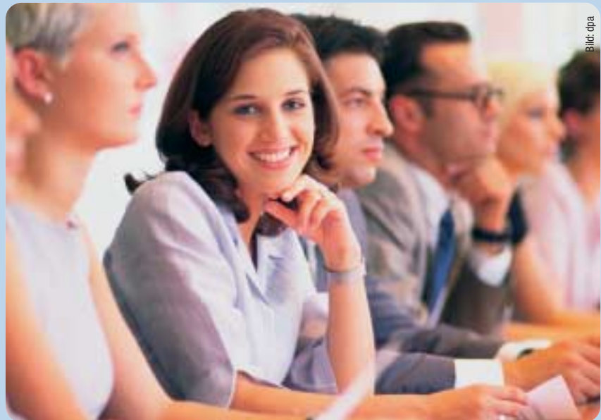
Berufstätigkeit und Kinderwunsch miteinander verbinden.

Bisher wird der CDU, insbesondere in den Großstädten, ein stark auf das klassische Familienbild zugeschnittenes Profil attestiert und gleichzeitig ein Mangel an Wahrnehmung der gesellschaftlichen Realitäten vorgeworfen. Obwohl wir in Frankfurt längst die Breite der gesellschaftlichen Herausfor-