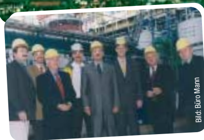
Thomas Mann MdB (Bildmitte) ist vor Ort: Mehr als 80 Unternehmen mit rund 22.000 Beschäftigten haben auf dem über vier Quadratkilometer großen Gelände des Industrieparks Frankfurt-Höchst mit seiner gewachsenen Infrastruktur einen Standort für ihr Unternehmen gefunden.

wird unterstützt, die Umsetzung jedoch ist problematisch, wenn Registrierungskosten bei der Europäischen Agentur in Helsinki zwischen 20.000 und 400.000 Euro liegen. Da 30.000 Stoffe zu registrieren sind, dürfte es zu Wartezeiten von 5–12 Monaten kommen. Von diesen Belastungen sind vor allem die kleinen und mittelständischen Unternehmen – und somit 90 % der Chemischen Industrie - betroffen.