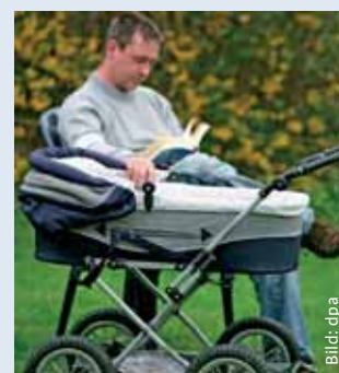
Ist das Elterngeld ein Anreiz für Väter, Erziehungsurlaub zu nehmen?

Nicht das Kindergeld, sondern das bislang gezahlte Erziehungsgeld wird ersetzt, das maximal 300 Euro im Monat für zwei Jahre oder 450 Euro im Monat für ein Jahr betrug. Durch das neue Elterngeld wird es auch den gut Verdienenden erleichtert, Elternzeiten zu nehmen. Kindergeld wird weiterhin zusätzlich bezahlt. Es beträgt für das erste bis dritte Kind jeweils 154 Euro und für jedes weitere Kind 179 Euro monatlich.