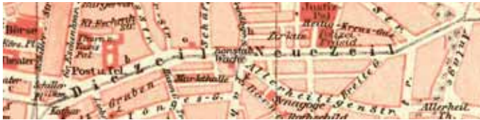
Die Zeil um 1900. Ausschnitt aus einem Stadtplan von Frankfurt am Main.