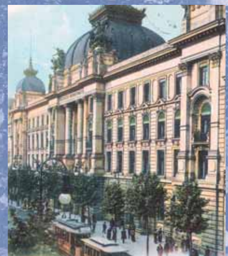
Bildpostkarte in Farbdruck nach kolorierter Fotografie