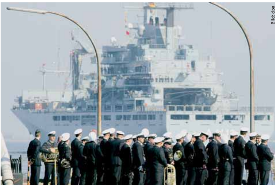
Der Einsatzgruppenversorger »Frankfurt am Main« verlässt den Marinestützpunkt in Wilhelmshaven und nimmt Kurs auf die libanesischen Küste.