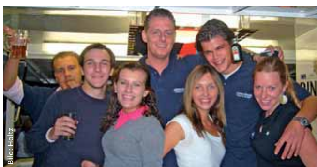
Wer hart arbeitet, darf ruhig auch mal feiern: Die JU Frankfurt auf dem Schweizer Straßenfest.

Festbesucher angesprochen. Die JU Süd wiederum warb an ihrem traditionellen Bierwagen nicht nur wieder über 30 neue JU-Mitglieder, sondern auch für die »Stiftung Leberrecht« der Frankfurter Neuen Presse, an die auch sämtliche Erlöse geflossen sind. Nicht nur für die Sachsenhäuser Jugend ist der JU-Stand mittlerweile DIE feste Größe und DER Treffpunkt beim Schweizer Straßenfest. (wh)