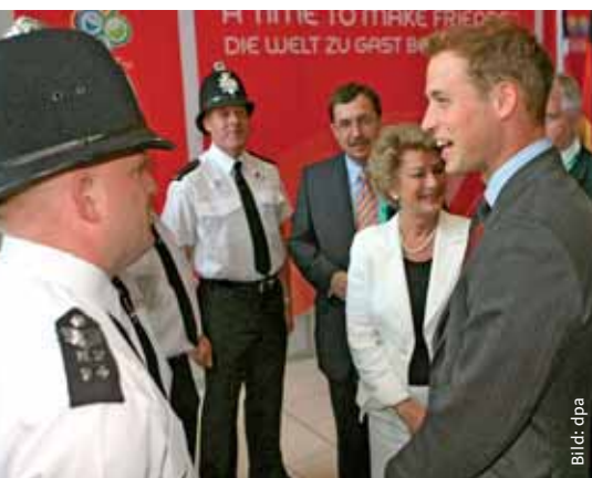
Gemeinsame Streifenwege der englischen Bobbies mit ihren Frankfurter Kollegen waren zur WM eine große Hilfe. Zum Spiel England gegen Paraguay traf auch Prinz William als hoher Besuch in Frankfurt ein, der hier von Oberbürgermeisterin Petra Roth, begleitet von einigen britischen Polizisten, empfangen wird.

Was die vielen tausend Einsatzkräfte während der WM geleistet haben, darauf können alle völlig zu recht stolz sein. Frankfurt hat sich von seiner besten Seite gezeigt.