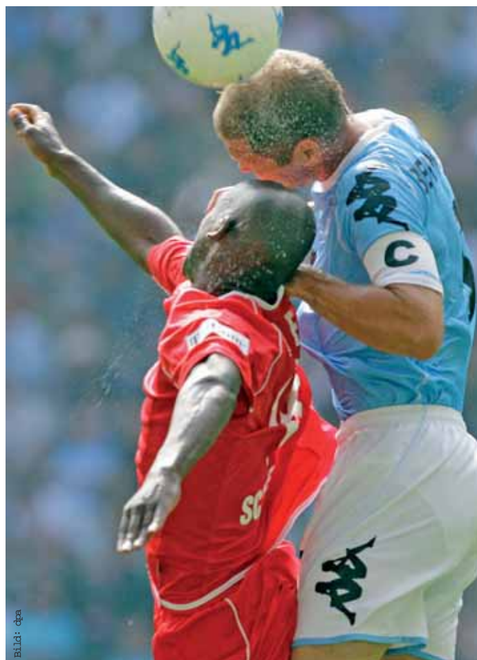
Sport soll verbinden: Gemeinsam statt gegeneinander.

Die Fußball-Weltmeisterschaft ist zu Ende; die Bundesliga hat uns wieder. Die tolle Stimmung der WM, die bei uns in Frankfurt ihre Sternstunden hatte, übertrug sich zum Glück auf den alltäglichen Fußball. Für die Eintracht läuft es mittlerweile besser. Die Saison ist allerdings jung und mit langem Atem werden wir andere Mannschaften sicher noch aus der Puste bringen! Fußball ist nicht nur ein nationales Anliegen, sondern seit langem ein europäisches. In einer Anhörung im Europäischen Parlament (EP) diskutierten über 300 Vertreter von Amateur- und Profivereinen, Ex-Fußballstars wie Karl-Heinz Rummenigge sowie politisch Verantwortliche die gesellschaftliche Rolle des Fußballs. Sie schilderten von Projekten, welche die sozialen, kulturellen und sprachlichen Barrieren überwinden halfen. Ein Beispiel für viele: Der Proficlub Celtic Glasgow erläuterte, wie es gelang, Jugendliche durch Fußball vom Einstieg in die Drogen- und Kriminalitätsszene abzuhalten.