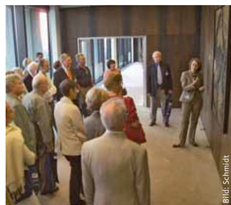
Die Besuchergruppe des AK Wirtschaft bei ihrer Führung durch die Kunstsammlung der Deutschen Bundesbank.