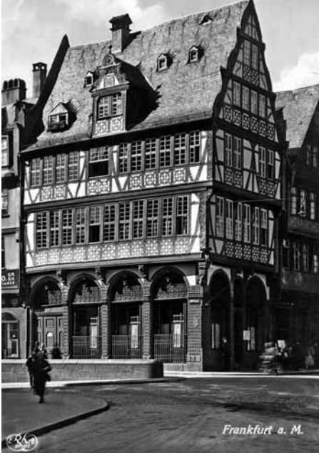
Rekonstruktion wahrscheinlich: Das Haus »Zur Goldenen Waage« in der Altstadt, 1944 bis auf die Mauern des Sandstein-Sockels niedergebrannt, hier abgebildet auf einer echtfotografischen Postkarte um 1920.