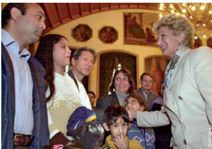
Die Integrationspolitik ist in Frankfurt am Main auf einem guten Weg: Oberbürgermeisterin Petra Roth begrüßt bei einer Einbürgerungsfeier im Kaiser-Saal des Frankfurter Römer rund 400 ausländische Bürgerinnen und Bürger.

gelingen wird. CDU und Grüne haben hierfür die Weichen gestellt.