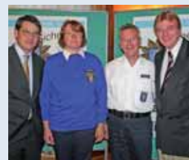
Signalblau für mehr Sicherheit: Innenminister Volker Bouffier (r.) und Stadtrat Boris Rhein (l.) mit zwei Polizeihelfern.

Mit dem Gesetz zur aktiven Bürgerbeteiligung zur Stärkung der Inneren Sicherheit (Hessisches Freiwilligen Polizeidienst-Gesetz) wurden dem Freiwilligen Polizeidienst Aufgaben übertragen und Befugnisse eingeräumt. Freiwillige Polizeihelfer tragen blaue Dienstkleidung und stehen zum Land Hessen in einem öffentlich-rechtlichen Dienstverhältnis. Die Dauer der Ausbildung beträgt mindestens 50 Stunden. Die Polizeihelferinnen oder -helfer müssen mindestens 18 Jahre und dürfen höchstens 65 Jahre alt sein. Ein vorbehaltloses Eintreten für die freiheitlich-demokratische Grundordnung sowie eine abgeschlossene Berufsausbildung bzw. ein Schulabschluss ist Voraussetzung. Außerdem müssen die Bewerber gesundheitlich fit und der deutschen Sprache in Wort und Schrift mächtig sein. Der Dienst findet in der arbeitsfreien Zeit statt, maximal 20 Stunden pro Monat.