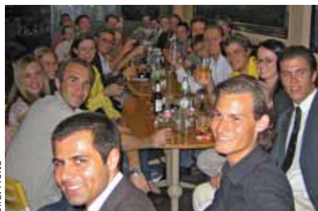
Er wird sicher zu einer Institution der »jungen Politik« in der Rhein-Main-Metropole: Der kreisweite Stammtisch der JU Frankfurt.

Der erste kreisweite Stammtisch der JU Frankfurt im Gemalten Haus fand am 05. September 2006 statt und stieß auf positive Resonanz. Nach Kommunalwahl, Fußball-WM und den Straßenfesten wurde diese erste Gelegenheit für ein gemütliches »come together« von vielen neuen Mitgliedern, Interessierten, aber auch von JU-Gästen aus vier Bundesländern dankbar angenommen. Mit über 45 JUlern war der Stammtisch sehr gut besetzt. Es wurde angeregt über aktuelle politische Themen diskutiert und es wurden Ideen für Veranstaltungen besprochen. Vier Gäste, die sich erstmal nur ein Bild von der JU Frankfurt machen wollten, waren so begeistert, dass sie sofort eintraten und sich zukünftig engagiert einbringen möchten. (uh)