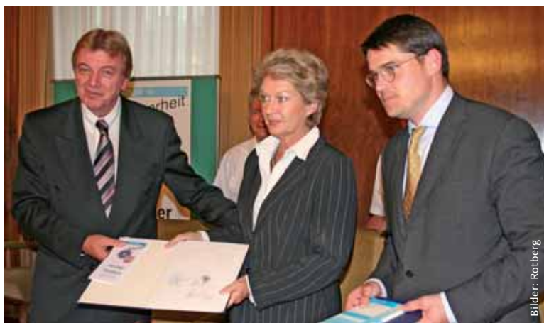
Vertragsunterzeichnung im Magistratssitzungssaal des Frankfurter Römer: Innenminister Volker Bouffier, Oberbürgermeisterin Petra Roth und Stadtrat Boris Rhein (v.l.n.r.)