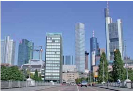
Der Finanzplatz Frankfurt ist in Bewegung.