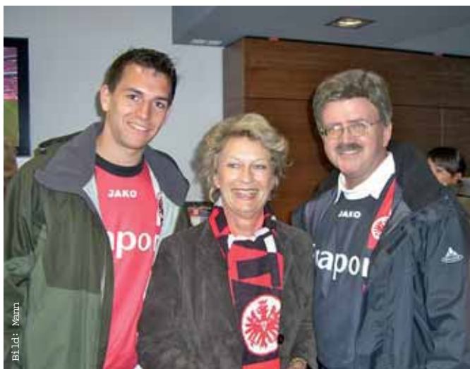
Zwei große Fans der Frankfurter Eintracht. Rechts im Bild: Europaabgeordneter Thomas Mann mit der Frankfurter Oberbürgermeisterin Petra Roth und einem weiteren Frankfurter Fan.

Es ging auch um die Vermarktung von Fußballrechten im Fernsehen und die Voraussetzungen für faireren Wettbewerb. Ein EU-Beschluss würde sich auf die Erste und Zweite Bundesliga auswirken. Ich bin dafür, dass die Solidargemeinschaft nicht durch Alleingänge großer Vereine bei der TV-Vermarktung gefährdet werden darf.