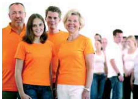
Gleichbehandlung im Alltag ist oftmals schwierig.