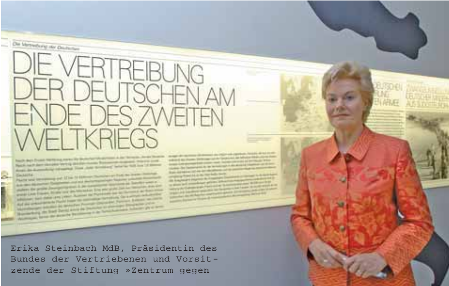
Erika Steinbach MdB, Präsidentin des Bundes der Vertriebenen und Vorsitzende der Stiftung »Zentrum gegen