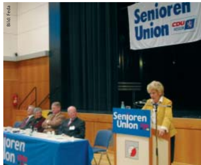
Oberbürgermeisterin Petra Roth stellt Schwerpunkte des neuen Kommunalwahlprogramms vor.

Ein volles Haus hatte OB Petra Roth am 10. Januar bei der Frankfurter Senioren Union im »Haus Ronneburg«. Vor den rund 200 versammelten Seniorinnen und Senioren strich sie besonders das kommunalpolitische Profil der Frankfurter CDU heraus. Der bevorstehende Kommunalwahlkampf biete die Chance, deutlich zu machen, was die CDU für Frankfurt wolle und was sie bei einer bürgerlichen Mehrheit in der Stadtverordnetenversammlung auch umsetzen könne. Als Erfolg der CDU bezeichnete die Oberbürgermeisterin, dass die Sicherheitslage objektiv, aber auch dem subjektiven Gefühl nach in den letzten fünf Jahren deutlich besser geworden sei. Dies sei der verstärkten Präsenz von Polizisten im Straßenbild zu verdanken sowie der Videoüberwachung an besonderen Brennpunkten. Im Hinblick auf den 26. März appellierte die Oberbürgermeisterin an die Seniorinnen und Senioren, von ihrem Wahlrecht Gebrauch zu machen. Es komme darauf an, für Frankfurt klare politische Verhältnisse zu schaffen. Das Viererbündnis habe seine Zeit gehabt. Frankfurt brauche eine bürgerliche Mehrheit mit einer CDU als stärkste politische Kraft. Ziel der CDU sei »40 Prozent plus«. »Das wäre dann auch ein gutes Ergebnis für Frankfurt«, stellte Roth fest. (cw)