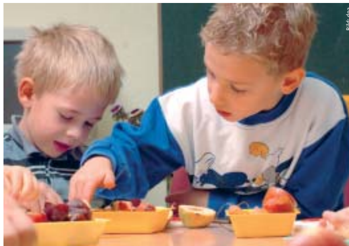
Zwei Vorschulkinder untersuchen verschiedene Früchte. Nach den Vorstellungen der CDU sollen Fünf- bis Sechsjährige in einem verpflichtenden Vorschuljahr auf den künftigen Schulunterricht vorbereitet werden.

Es ist erfreulich, dass die Bundesregierung auch die Konzepte der Mehrgenerationenhäuser fördern will. Mehrgenerationenwohnen haben wir in Frankfurt bereits in den Stadtteilen Bergen-Enkheim und Preungesheim erfolgreich verwirklicht. Mehrgenerationenhäuser sind als familienorientierte Dienstleistungsräume zur Erziehungs- und Familienberatung, Gesundheitsförderung, Krisenintervention und Hilfeplanung Orte, an denen sich Menschen tagsüber treffen können, und die über eine Krabbelgruppe und ein Jugendzentrum mit Hausaufgabenhilfe genauso verfügen wie über einen Seniorentreff – alles unter einem Dach. Die familienpolitischen Schwerpunkte unserer neuen Bundesministerin sind ausdrücklich zu begrüßen. Sie verzahnen sich mit den Zielen der Union hier in Frankfurt am Main. Die Frankfurter CDU will in der Familienpolitik an die Spitze. Wir wollen die besten Entfaltungs- und Bildungsmöglichkeiten für unsere Frankfurter Kinder. Wir wollen noch mehr Engagement für die Kleinsten, eine bessere unterstützende Infrastruktur für die Eltern und ein Plus beim Familien-Einkommen. Dann wird Deutschland wieder familienfreundlich und die Stadt Frankfurt eine Familienstadt.