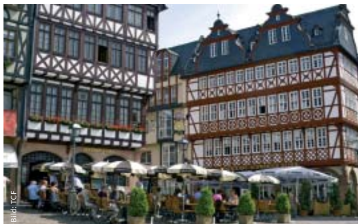
Heimat Frankfurt am Main: Römerberg mit Ostzeile und Schwarzem Stern.

Wir wollen Videotechnik an Stellen, wo dies notwendig ist, den freiwilligen Polizei-