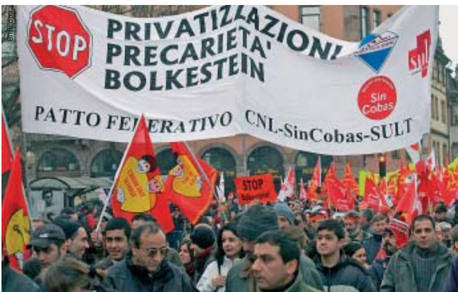
Mehr als 5.000 Menschen aus allen europäischen Staaten demonstrierten in Straßburg am 11. Februar 2006 gegen die Dienstleistungsrichtlinie.

Sollte das gesamte Parlament diesem Vorschlag in der Schlussabstimmung folgen, hätten wir einen tragfähigen Kompromiss, dem sich der Rat, die Vertretung der 25 Mitgliedstaaten, und die EU-Kommission hoffentlich anschließen.