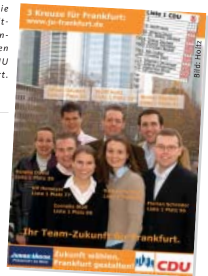
Die Stadtverordneten-kandidaten der JU Frankfurt.

ge Union die CDU tatkräftig mit ihrem Wahlkampfteam und beweist den Bürgern damit, dass sich in Frankfurt auch junge Menschen für Politik begeistern und engagieren. (ks)