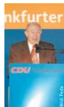
Dr. Günther Beckstein begeisterte mit seinen klaren Worten.

liche Situation in Deutschland. Die Hauptprobleme seien nach wie vor die hohe Arbeitslosigkeit und die Sanierung der öffentlichen Haushalte. Mit der großen Koalition könne man nun durch die gemeinsame Anstrengung der großen politischen Kräfte erreichen, endlich wieder mehr Wachstum zu schaffen, denn unter Rot-Grün sei Deutschland Schlusslicht in Europa gewesen. Als eine weitere große Zukunftsaufgabe sprach Beckstein das auch für Frankfurt wichtige Thema der Migration an. »Die Integration der Zuwanderer ist eine Riesenaufgabe, der wir uns zu stellen haben und die wir, da bin ich mir sicher, erfolgreich bewältigen werden«, so der bayerische Innenminister. Im Hinblick auf die bevorstehende Weltmeisterschaft betonte Beckstein die vorrangige Aufgabe der Sicherheit in den Austragungsstädten und in den Stadien. »Jeder muss bei der WM ohne Angst ins Stadion gehen können und sich sorglos ein Fußballspiel anschauen können«, sagte Beckstein abschließend. Der lang anhaltende Beifall des Publikums zeigte, dass mit Günther Beckstein ein bürgernahe Politiker und wirklicher Sympathieträger in den Frankfurter Westen gekommen war. In seinem Schlusswort wies der Kreisvorsitzende Udo Corts auf die am 26. März bevorstehende Kommunalwahl hin, bei der es für die CDU gelte, eine eigene bürgerliche Mehrheit zu erreichen, damit Frankfurt endlich wieder mit klaren politischen Verhältnissen regiert werden könne. (vw)